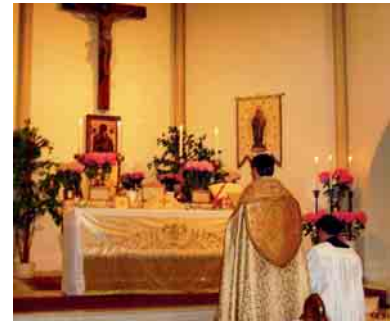
Hochamt in der Muttergotteskirche am Sonntag nach Christi Himmelfahrt

Nach einigen Wochen der Vorbereitung konnte das Gotteshaus am Christi-Himmelfahrtstag feierlich in „Besitz“ genommen werden. Schon bei der ersten hl. Messe dort zeigte sich, daß etliche Gläubige, die wegen der für sie ungünstigen Gottesdienstzeit am Sonntagabend seit Jahren nicht mehr zu uns kamen, nun wieder kommen werden.