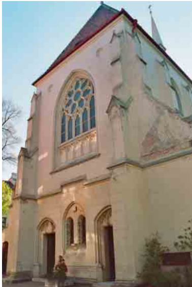
Muttergotteskirche in der Martinstraße, Wien-Währing

Im Südosten des deutschsprachigen Distriktes unserer Gemeinschaft liegt Wien, die Hauptstadt Österreichs. Seit mehr als anderthalb Jahrzehnten arbeiten Priester der Priesterbruderschaft St. Petrus in dieser geschichtsträchtigen Metropole, die sich seit der Osterweiterung Europas anschickt, ihre alte Bedeutung aus Zeiten der Donaumonarchie als wirtschaftliches und kulturelles Zentrum Südosteuropas wiederzuerlangen.