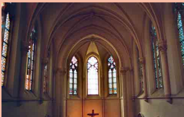
Die „neue“ Muttergotteskirche mit den schönen Glasmalereien. Links: Blick in den Chorabschluss; Rechts: Blick zur Sängerempore