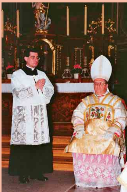
Links: Bischof Rifan (Campos) bei einem Besuch in Wien