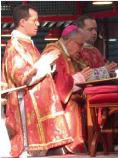
Der Erzbischof bei der Allerheiligenlitanei