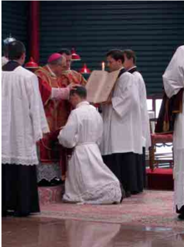
Handauflegung bei der Diakonatsweihe

Jesus selbst, der diese Prophezeiung des Isaias ganz klar auf sich selbst deutet (Mt 20, 24-29), sagt uns, daß Er gekommen sei um zu dienen, und daß die Größe seiner Jünger im Dienst an Gott liegt, und – aus Liebe zu Ihm – im Dienst an den Brüdern. Der Dienst des Diakons ist vor allem ein liturgischer, in der hierarchischen Unterordnung unter den Bischof und das Presbyterium; ein Dienst durch die Eucharistie und an der Eucharistie. Dieser vom Diakon den Gläubigen gespendete Dienst erlangt seine Wirksamkeit durch die Katechese, durch die Werke der Barmherzigkeit, durch den apostolischen Mut, durch die Beharrlichkeit in Bekenntnis des Glaubens bis hin zum Martyrium.