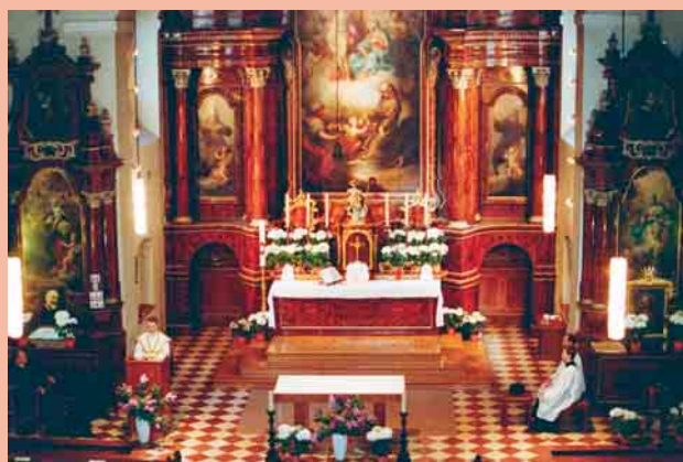
Rechts: Blick auf den Altar der Kapuzinerkirche beim Hochamt am Sonntagabend