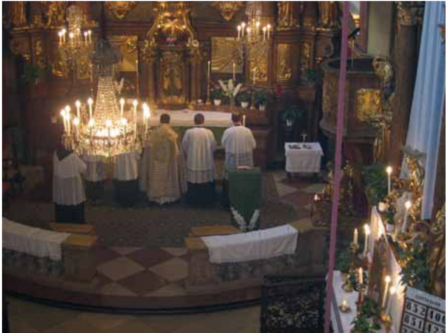
Nachprimiz in Wien

Das zitierte Wort aus dem Johannesevangelium wurde dann zunächst allgemein für alle Glieder der Kirche ausgelegt. Wenn die Getauften als Glieder am geheimnisvollen Leib Christi fest mit dem Haupt – Christus – verbunden seien, wenn sie als Reben eng am wahren Weinstock gedeihen, dann könne