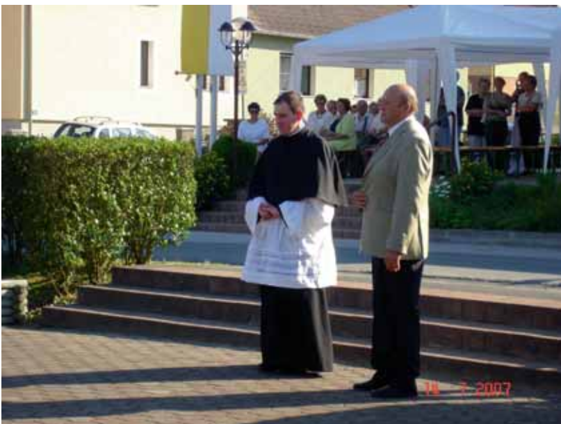
Empfang mit dem Bürgermeister im Heimatort