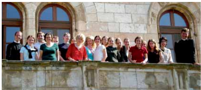
Die Pilgergruppe auf dem Balkon des Österreichischen Hospizes in Jerusalem

(Kirchstr. 16, D-88145 Wigratzbad, Tel: 08385/9221-0, Fax: 08385/9221-11, Mail: pfkb@ckj.de )