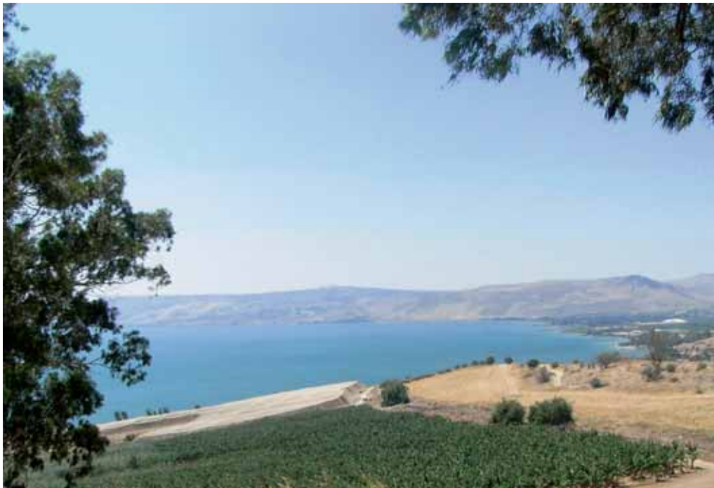
Blick auf den See Genezareth