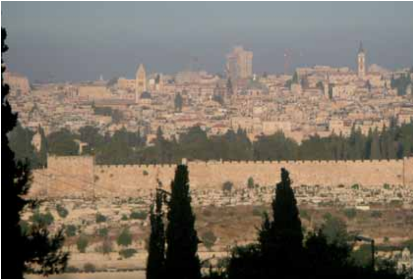
Die Altstadt Jerusalems vom Ölberg aus

sus auf einem Esel nach Jerusalem hineingeritten war. Von dort gingen wir zu Fuß über den Ölberg hinab, durchquerten das Kidrontal und gelangten durch das Stephanstor in die Altstadt von Jerusalem – die heilige Stadt! Sie wirkte auf einmal so vertraut, als würde man nach Hause kommen. Ja, tatsächlich, hier würden wir uns doch wohlfühlen! Nach ein paar hundert Metern mündete der schmale, gepflasterte Weg in eine Querstraße – die Via Dolorosa. Unser österreichisches Hospiz lag also direkt am Kreuzweg. Nachdem Pater Banauch am Sonntagmorgen eine Stadtführung ge-