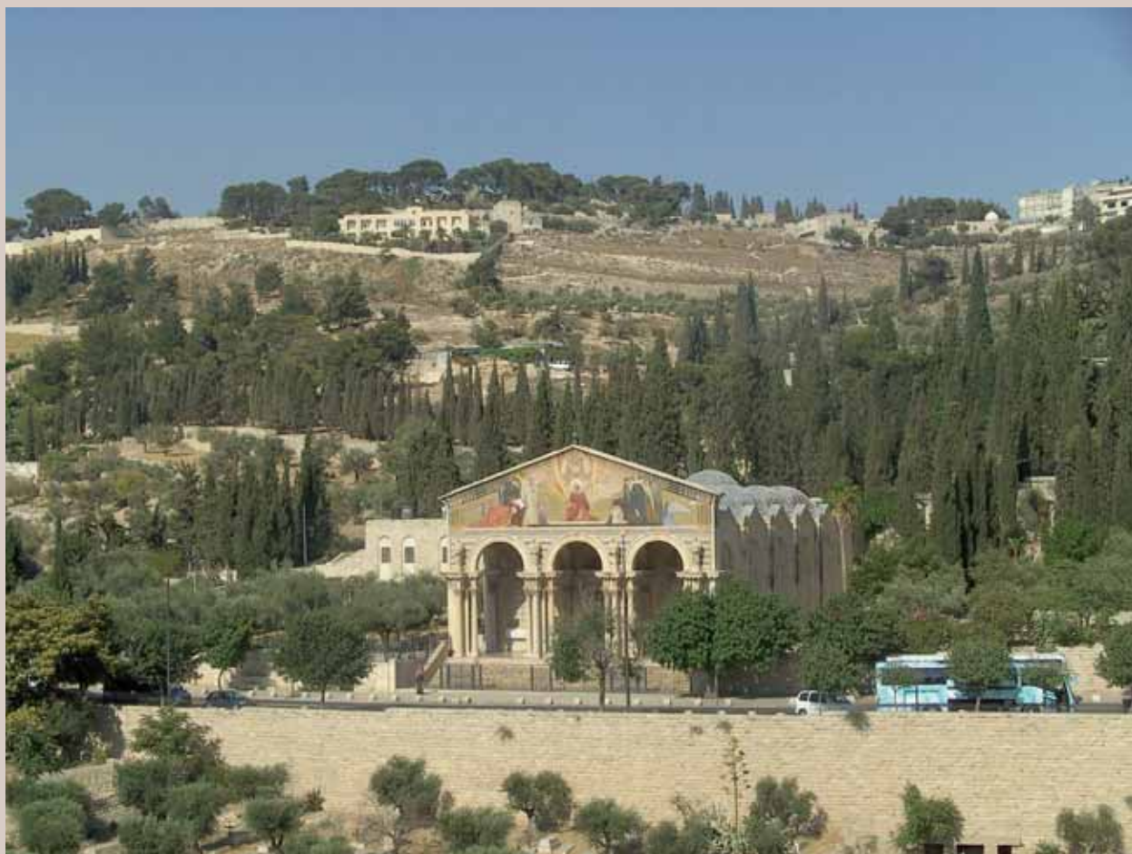
Die Gethsemaniebasilika am Ölberg