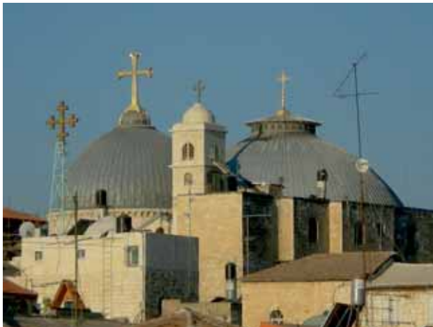
Die Kuppeln der Grabeskirche

sich auf Golgotha befindet, so ist es, als würde man mit Maria unter dem Kreuze knien.