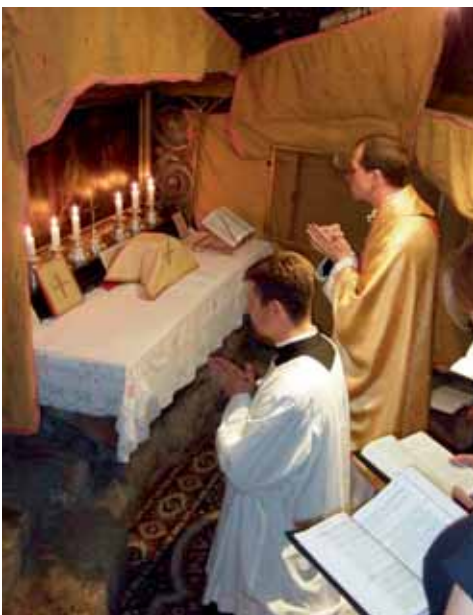
Weihnachtsmesse in der Geburtsgrotte von Bethlehem

Nach einem gemütlichen Essen auf der Straße bei einem Händler – dafür mußten wir nachher bei ihm einkaufen – besuchten wir noch die Hieronymusgrotte, die Milchgrotte und auf dem Heimweg das Grab der Seligen Mirjam von Abelin. Zum Schluß schauten wir noch in Ein Karem vorbei. An diesem besonders schönen Ort, in einem bewaldeten wilden Tal gelegen, hatte Zacharias ein Ferienhaus besessen. Es ist der Ort, wo Maria Elisabeth be-