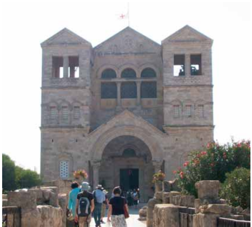
Die Kirche auf dem Berg Tabor

beteten wir am Ufer des Sees gemeinsam den Rosenkranz, wo wir uns die Geheimnisse des lichtreichen Rosenkranzes nur allzugut vorstellen konnten.