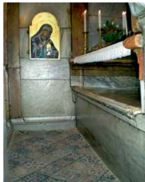
Das Innere des Heiligen Grabes

Die Kirche wird jeweils schon um fünf Uhr morgens geöffnet, so daß manche von uns, geweckt vom Muezzin, schon sehr früh aufstanden, um vor dem Frühstück noch möglichst lange auf Golgotha oder in der Grabkammer weilen zu dürfen. Für uns war diese Kirche etwas ganz Besonderes. Sie strahlt große Ruhe und tiefen Frieden aus. Wenn man