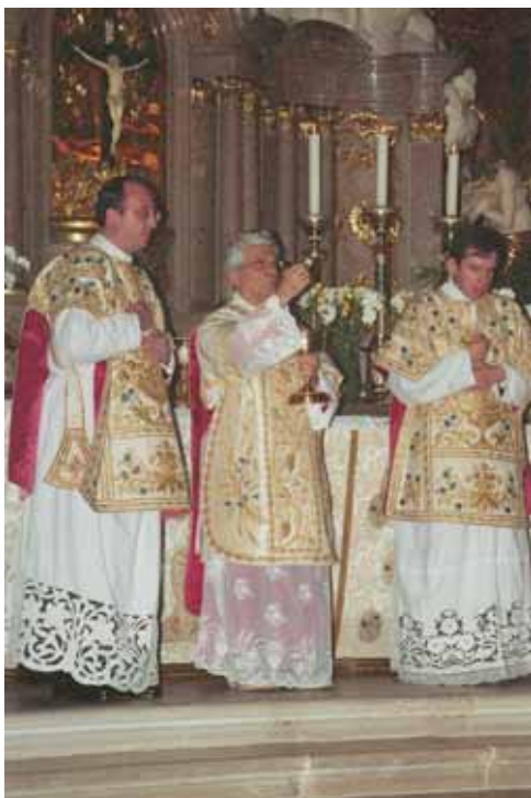
Ecce Agnus Dei – vor der Kommunionsspendung

Papstes und seines Vorgängers nachgesonnen haben.