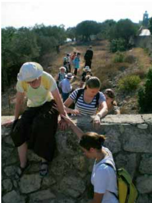
Den Tabor hinan gab es auch Hindernisse zu überwinden

Zwei Tage blieben wir in unserer Unterkunft in Tabgha, das, direkt am See gelegen, von Bananen- und Mangopflanzungen, Zitrusbäumen, Palmen und einer Vielfalt an herrlichen Blumen umgeben ist. Abends