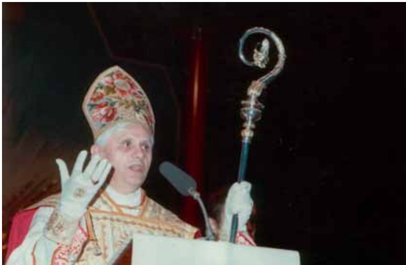
Predigt an Ostern 1990 in Wigratzbad beim Besuch des Priesterseminars St. Petrus

zu den politisierenden Entwürfen der „Theologie der Hoffnung“ und der „Befreiungstheologie“. Damit hatte sich unser Papst bereits als Professor und später an der Glaubenskongregation kritisch zu befassen, erkannte er doch deutlich die Gefährlichkeit einer solchen Neuinterpretation der Hoffnung. In der Enzyklika „Spe Salvi“ nun setzt er diese Gedankenbahnen fort. Dabei geht es Benedikt XVI. nicht nur darum zu zeigen, daß der als „Hoffnung“ präsentierte Machbarkeits-Wahn zum Scheitern verurteilt ist. Der Papst bleibt auch die wahrhaft notwendige Antwort nicht schuldig, denn er stellt uns das christliche Hoffen auf Gott, auf die Macht Seiner göttlichen Erlöserliebe, vor Augen.