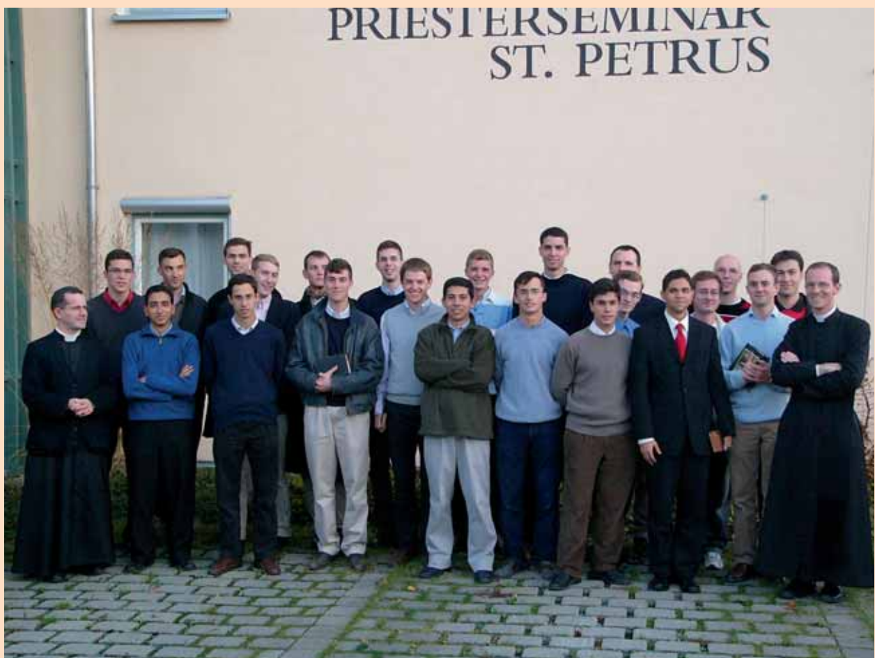
23 Neueintritte im Priesterseminar St.Petrus