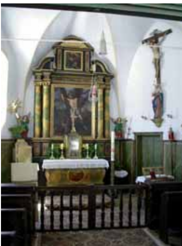
Die Kapelle in Partenkirchen

Am Fest der Kreuzerhöhung, genau am ersten Jahrestag der Inkraftsetzung des Motu Proprio „ Summorum Pontificum Cura “, konnten wir mit einem gesungenen Amt unsere Arbeit in Garmisch-Partenkirchen (Erzdiözese München-Freising) aufnehmen. Um die 50 Gläubige hatten sich zu dieser ersten Meßfeier im überlieferten Ritus in der kleinen Sebastianskirche im Zentrum Partenkirchens eingefunden. Vorausgegangen war ein Antrag an den zuständigen Ortspfarrer und eine ausdrückliche Genehmigung und Beauftragung durch das Münchner Ordinariat. Die Gottesdienstgemeinde versammelt sich nun jeden Sonn- und (kirchlichen) Feiertag um 9.30 Uhr zum Rosenkranz mit Beichtgelegenheit. Die hl. Messe beginnt um 10.00 Uhr. Betreut wird die Gemeinde von Priestern unserer Gemeinschaft, die aus Wigratzbad oder Bettbrunn anreisen. Alle Gläubigen aus dem Werdenfelser Land und aus der weiteren Umgebung sind herzlich eingeladen.